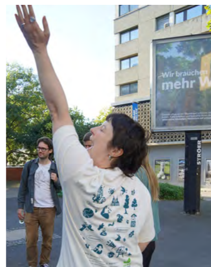
Neuer PRIMAKLIMA-Merch Erstmals begleiten uns eigene T-Shirts bei Veranstaltungen. Das Design greift zentrale Elemente unserer Arbeit visuell auf.

Diese Bewertungen bestätigen unseren Anspruch, Projekte mit hoher Qualität und nachvollziehbarer Wirkung zu entwickeln und zu unterstützen.