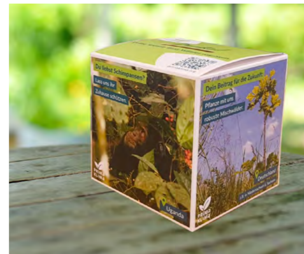
PRIMAKLIMA-Spendenbox Für noch mehr Freude beim Spendensammeln mit Familie und Freund:innen, im Unternehmen oder der Schule. Meldet euch einfach bei uns, wir schicken sie dann per Post zu.

Aus den neuen Regelungen des Pariser Abkommens und den europäischen Richtlinien zu transparenten Claims haben wir eindeutige Konsequenzen gezogen. Transparenz und Klarheit sind wichtiger denn je – deshalb wird das Siegel der „Klimaneutralität“ Ende 2025 auslaufen. Bereits in den letzten Jahren war der Begriff der Klimaneutralität stark umstritten und findet ab 2026 auch rechtlich sein Ende. Wir haben das neue Label „Klimaschutzbeitrag“ entlang der kommenden Anforderungen entwickelt und zum 1.1.25 eingeführt. Mit dem Label bieten wir Unternehmen eine klare und glaubhafte Möglichkeit, ihren Beitrag zum globalen 1,5 Grad-Ziel zu kommunizieren. Was uns sehr freut: Fast alle Kooperationspartner sind diesen neuen Weg mitgegangen – ein starkes Zeichen für Verantwortung und Glaubwürdigkeit, vor allem aber für das Vertrauen in unsere Arbeit.